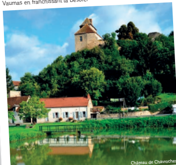
Château de Chavroches

Après 500 m, remarquer à gauche le château de Chassimpierre . Au cédez-le-passage, rejoindre la D53 à suivre à gauche jusqu'à Vaumas en franchissant la Besbre.